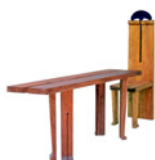
Macht + Vergänglichkeit