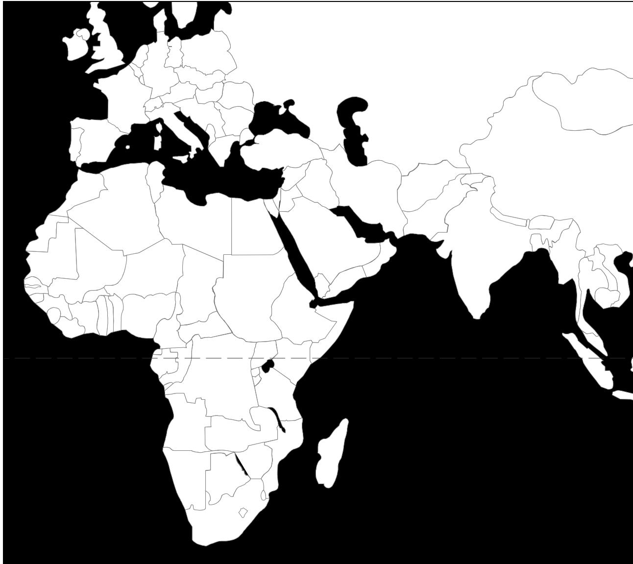
Die Verbreitung des Islam